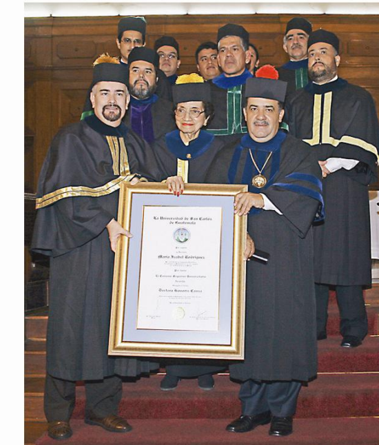
La nueva Doctora Honoris Causa por la Universidad de San Carlos de Guatemala, en compañía del Consejo Superior Universitario.