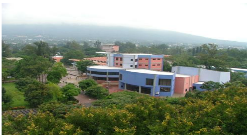
Campus Universidad de El Salvador

Visión: Ser una universidad transformadora de la educación superior y desempeñar un papel protagónico relevante, en la transformación de la conciencia crítica y prepositiva de la sociedad salvadoreña, con liderazgo en la innovación educativa y excelencia académica, a través de la integración de las funciones básicas de la universidad: la docencia la investigación y la proyección social.